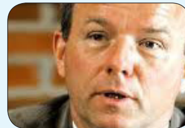
Orla Hav Folketingsmedlem Nørresundby