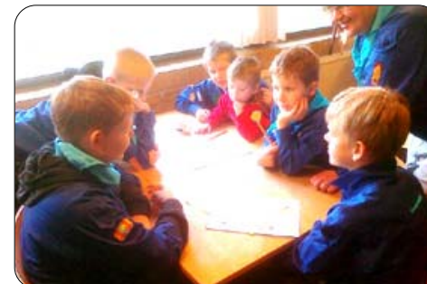
Både inde og ude var der spændende aktiviteter på Aalborgspejdernes kredsweekend den første weekend i februar